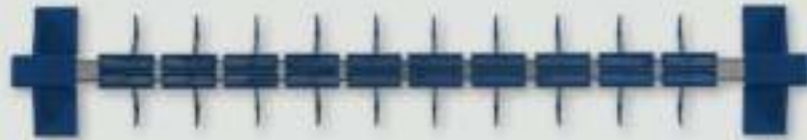
Schmuckhalter Material: Kunststoff