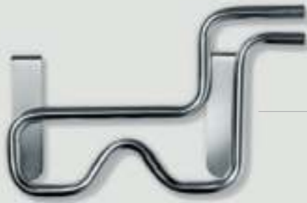
Kühlschlange Material: Edelstahl

Technik von Elma ist weit mehr als nur die reinen Geräte zur Reinigung. Mit unserem Zubehör können Sie die Easy Serie ausbauen – einfach und praktisch.